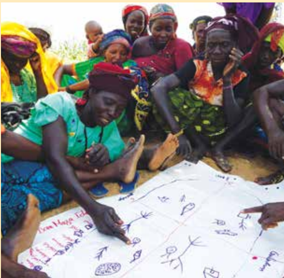
Des femmes prenant part à l'analyse de la vulnérabilité au changement climatique et de la capacité d'adaptation dans la communauté de Dan Maza Idi à Dakoro, Niger, Awaiss Yahaya/ALP-CARE 2010

Pour son analyse participative, ALP a utilisé des outils participatifs d'évaluation rurale (PRA), ceux-là mêmes qui sont présentés dans le Manuel de l'Analyse de la Vulnérabilité au Changement Climatique et de la Capacité d'Adaptation (CVCA) de CARE (voir la section Références pour plus d'informations), comme point de départ pour guider les discussions en groupes témoins, outils qui ont été conçus pour permettre aux groupes communautaires de partager leurs idées et de développer une compréhension commune des questions. Parmi les outils de la CVCA utilisés figurent la cartographie des aléas, les calendriers saisonniers, les tableaux chronologiques, les matrices de la vulnérabilité et les Diagrammes de Venn. Ils ont été complétés par d'autres outils ayant permis d'explorer les dimensions climatiques de façon plus approfondie, comme par exemple les outils d'analyse du changement climatique développés par Christian