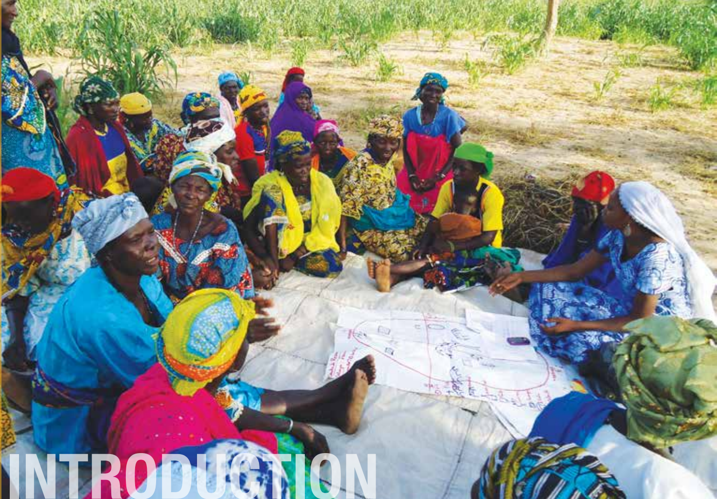
Des femmes de Dakoro, au Niger, prenant part à des discussions sur la vulnérabilité et les capacités en matière de climat.