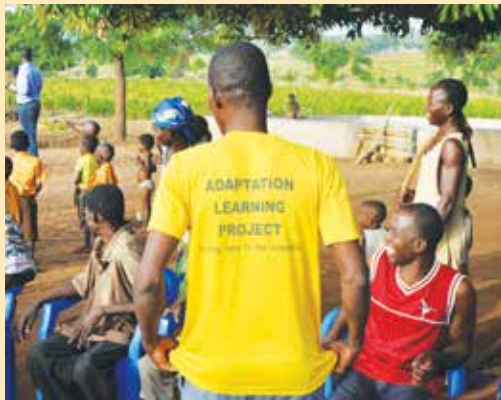
Le Moniteur de la communauté de Zambulugu rencontre la communauté.

Au Ghana, le suivi de la mise en œuvre des Plans d'Action Communautaires d'Adaptation est assuré par des animateurs communautaires qui ont bénéficié d'une formation offerte par le programme. Les animateurs communautaires ont reçu des communautés le mandat de suivre la mise en œuvre des mesures d'adaptation planifiées, ainsi que d'autres indicateurs (tels que les précipitations, là où des pluviomètres ont été installés). Ils facilitent l'apprentissage continu des membres communautaires, à travers des réunions communautaires de réflexion et la revue des PACA, conduisant ainsi à l'ajustement des plans et à des prises de décision plus éclairées sur les conditions de vie.