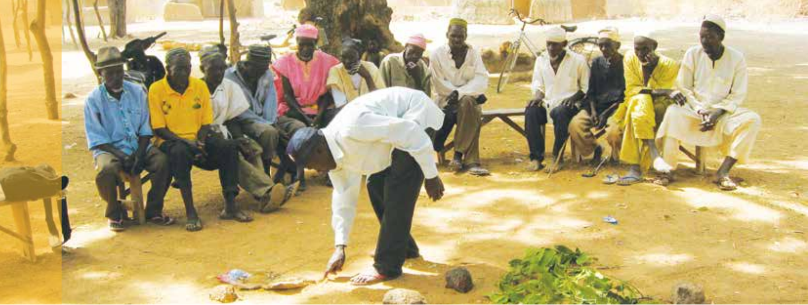
Activité de visualisation de l'avenir à Tariganga dans le Nord du Ghana.