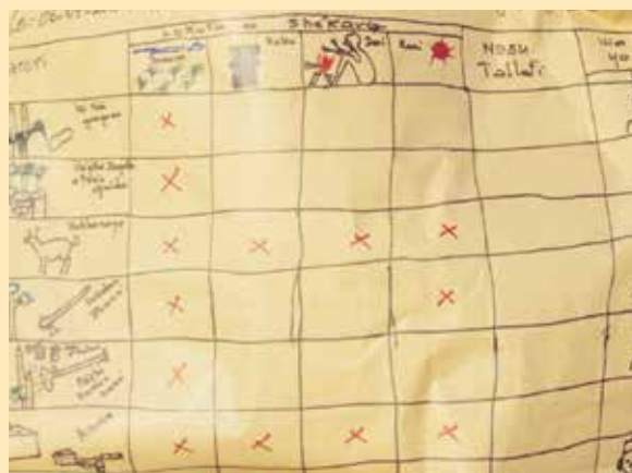
La PACA de Dan Maza Idi utilise des symboles pour illustrer les différentes activités du plan.

Au Niger, où les niveaux d'analphabétisme sont élevés, ALP a utilisé une approche créative pour s'assurer que tous les membres communautaires peuvent accéder et comprendre le Plan d'Action Communautaire d'Adaptation. L'équipe de facilitation de la PACA a travaillé avec les membres communautaires afin de mettre au point un ensemble de symboles qui représentent différents éléments du plan. Le plan d'action est affiché dans la communauté en un endroit où tout le monde peut le voir et la version en images est là pour s'assurer que tous les membres communautaires, même ceux qui sont analphabètes, peuvent le comprendre.