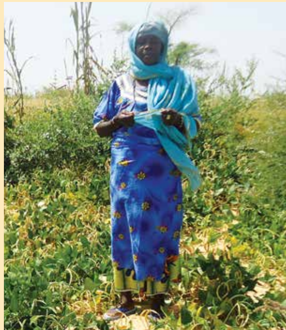
Femme de la communauté de Dan Maza Idi debout dans ses cultures de niébé prêtes à la récolte issues des semences distribuées par ALP et qui arrivent à maturité après 45 jours.

Par exemple, quand l'ALP a commencé à intervenir au Niger en 2011, il était évident dès l'analyse CVCA et le processus de planification de la CAPA que les communautés se remettaient encore des effets de la grave sécheresse de l'année précédente. ALP a distribué des semences résistantes à la sécheresse et hâtives dans le cadre d'une initiative d'activités « à effet rapide » pour répondre aux besoins immédiats en sécurité alimentaire des populations, tout en travaillant avec la communauté pour les aider à comprendre les options de conditions de vie résilientes sur le long terme.