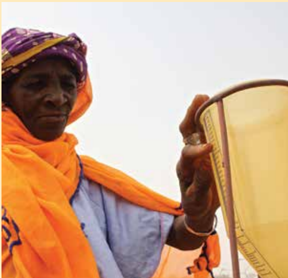
Volontaire Alerte Précoce de la communauté de Dela Jari enregistrant le relevé pluviométrique au village de Aman Bader, Niger.

Au Niger, ALP a joué un rôle dans la mise en place et le renforcement des systèmes communautaires de suivi de la vulnérabilité (SCAP / RU). Chaque communauté choisit un comité de gens chargés de faire le suivi de quatre principaux domaines de conditions de vie, en plus des informations sur la situation climatique, en utilisant des indicateurs standards localisés tels que la disponibilité et le prix des céréales, le calendrier et la quantité des précipitations, la production céréalière et l'apparition des ennemis de cultures. Il existe quatre niveaux d'alerte (normal, avertissement, alerte et urgence), qu'ils déterminent en fonction de la gravité de l'information reçue et de l'efficacité des stratégies d'adaptation en cours. Cette information est utilisée pour informer la prise de décision communautaire et déclencher des plans d'urgence communautaires élaborés avec l'appui de