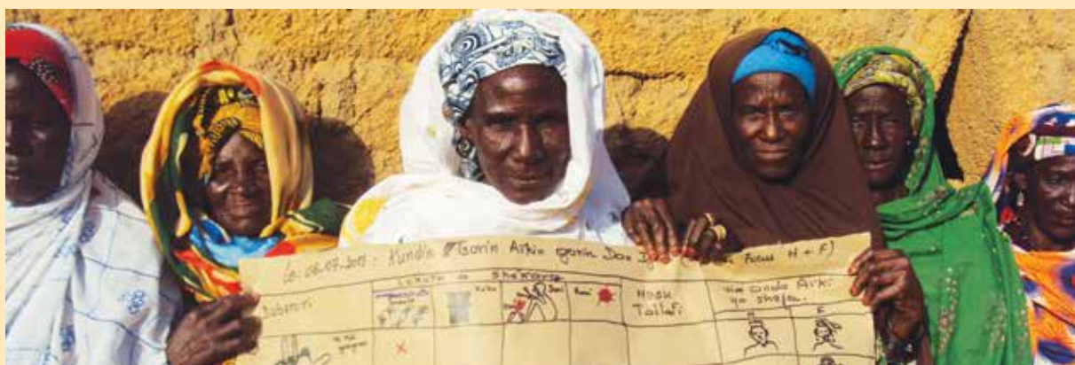
Des femmes de la communauté de Dan Maza Idi à Dakoro, Niger, présentant leur PACA.

La présentation des PACA aux autorités locales par les représentants de la communauté est une demande solennelle et symbolique de la redevabilité des membres communautaires de la part des détenteurs d'obligations au Ghana. Elle démontre le niveau de responsabilité des communautés pour faciliter le développement de l'auto-assistance, et pour exiger plus de réaction de l'administration locale. La remise solennelle de la PACA aux autorités locales par les citoyens établit la base pour le plaidoyer et l'engagement subséquent des communautés envers les institutions puisque la PACA est sensée être un document source en matière d'intégration des stratégies de l'ABC dans les plans et les budgets des collectivités locales.