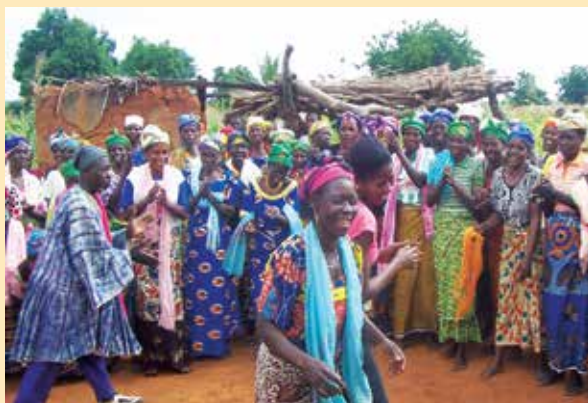
Des femmes du durbar de la communauté de Zambulugu dans le Nord du Ghana dansant pour initier le lancement du processus de la planification d'action communautaire d'adaptation.

Au Ghana, la mobilisation communautaire initiale s'est faite à travers ce qu'on appelle un « durbar », un rassemblement traditionnel regroupant les membres communautaires, le chef et d'autres leaders locaux. Lors de ces rencontres, l'équipe de facilitation a expliqué le Processus de la PACA, les membres communautaires ont posé des questions, et les rôles et responsabilités, ainsi que les calendriers des réunions ont été décidés de commun accord. Des cérémonies ont été organisées pour marquer l'engagement de la communauté envers le processus, et il y'avait des chants, des danses, des prières et des sacrifices pour s'assurer du soutien de leurs dieux pour les actions à venir.