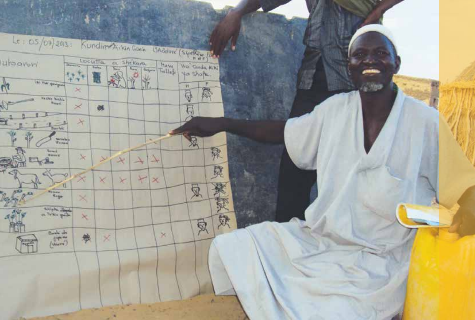
Le Moniteur Communautaire de Baadare (Commune de Soly Tagris) à Dakoro, Niger, présentant la PACA.