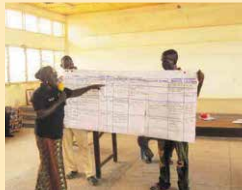
Présentation de la PACA de Jawani à l'Assemblée du District de Mamprusi Est.

L'équipe de ALP Ghana a réussi à appuyer l'intégration des priorités issues du processus des PACA dans les plans de développement des districts de Garu Tempane et Mamprusi Est. Les agents de l'Etat ont participé à la facilitation du processus d'analyse participative avec les communautés dans leurs districts, ce qui leur a permis de mieux comprendre les problèmes du changement climatique auxquels sont confrontés les femmes et les hommes dans leurs circonscriptions. Une fois que les Plans d'Action Communautaires d'Adaptation aient été élaborés, les leaders communautaires les présentent aux assemblées de district lors d'un forum public, les rendant redevables pour avoir tenu compte d'eux dans les plans communaux. En plus de la promotion d'une planification résiliente au climat dans ces deux districts, cet exercice a permis la révision des directives de la planification nationale pour tous les districts pour tenir compte des questions du changement climatique. En outre, les rapports et la communication entre les communautés et leurs prestataires de services publics au niveau local se sont améliorés.